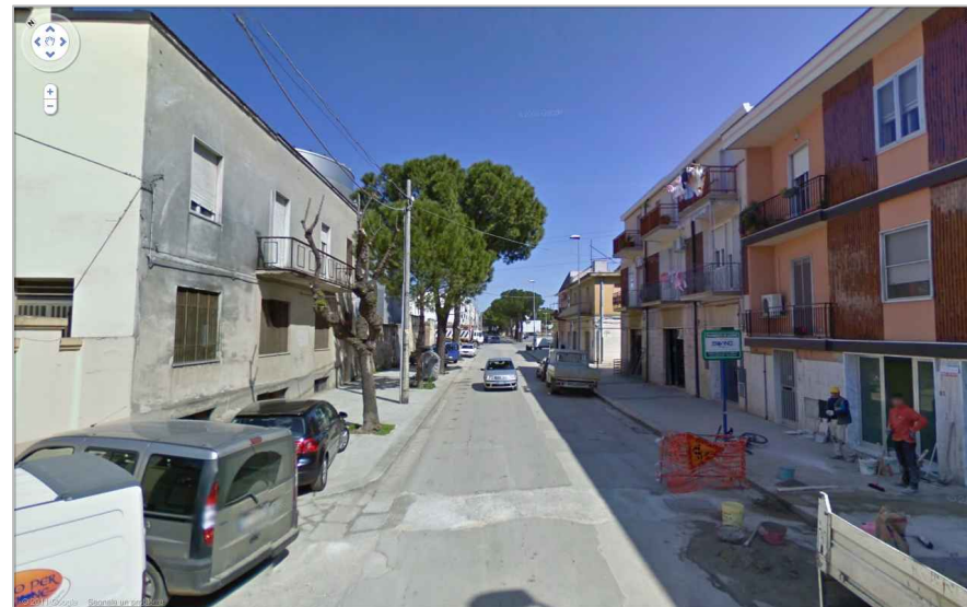
stato di fatto

planimetria di intervento, approfondimenti progettuali