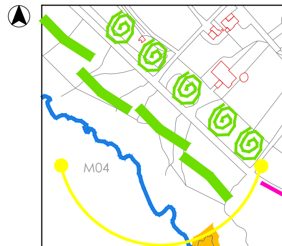
prevalenza di arbusti per incrementare la macchia esistente in prossimità del costruito e per le nuove piazze-giardini. tappezzanti sulla linea di costa

INTERVENTO - STRATEGIE GENERALI: rinaturalizzazione e progettazione ambientale selezione delle specie arboree, arbustive, tappezzanti idonee: utilizzo delle specie alofite utilizzo di strategie per consentire alle piante di svilupparsi e vivere su rocce affioranti, in ambienti costieri e condizioni estreme: modellazione di rilevati con biostuoia in juta per la piantumazione delle tappezzanti creazione di ripari dai venti per la piantumazione delle specie arbustive