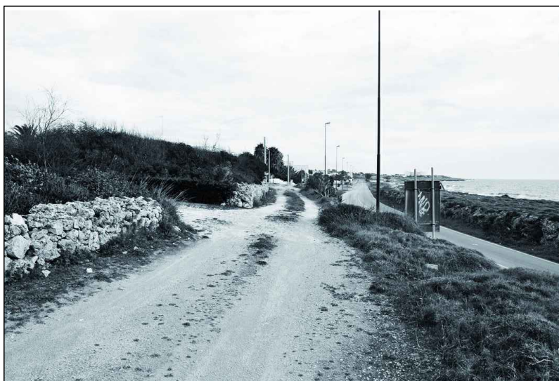
STATO DI FATTO FOTO N°1