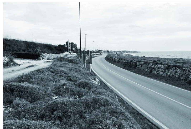
STATO DI FATTO FOTO N°2