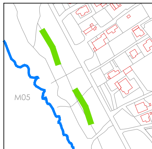
tappezzanti sulla linea di costa

Elenco delle opere con la specificazione degli interventi principali. Rimozione smontaggio e trasporto in altra sede degli elementi disposti sull'area di intervento, da riutilizzare secondo le indicazioni del progetto; Interventi di demolizione, sbancamento superficiale, formazione di rilevati necessari per rimodellare il suolo secondo le pendenze naturali e per la formazione di terrazze e rampe anche per agevolare l'accessibilità alle persone con difficoltà motorie. Interventi di ingegneria ambientale, pavimentazioni e arredo urbano consistenti in: • consolidamento e contenimento dei terrazzamenti, per la formazione dello spazio pubblico aperto alla socialità e, nel periodo estivo, anche alla balneazione; • protezione ed espansione dei nuclei di vegetazione naturale attualmente in stato di degrado e rigenerazione delle essenze vegetazionali tipiche (macchia mediterranea); • formazione di "strada bianca" a velocità lenta, in terra battuta stabilizzata, funzionale e riservata agli accessi alle residenze, alla chiesa e ai locali commerciali prospicienti lo spazio pubblico, assicurati e protetti da un ampio marciapiede pavimentato. • collocazione degli elementi di arredo urbano.