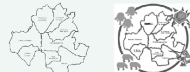
Tavola n. Contenuto: 1. Inquadramento territoriale

CELENZA VALFORTORE SAN MARCO LA CATOLA CASALNUOVO MONTEROTARO CASALVECCHIO DI PUGLIA CASTELNUOVO DELLA DAUNIA PIETRA MONTECORVINO MOTTA MONTECORVINO VOLTURINO