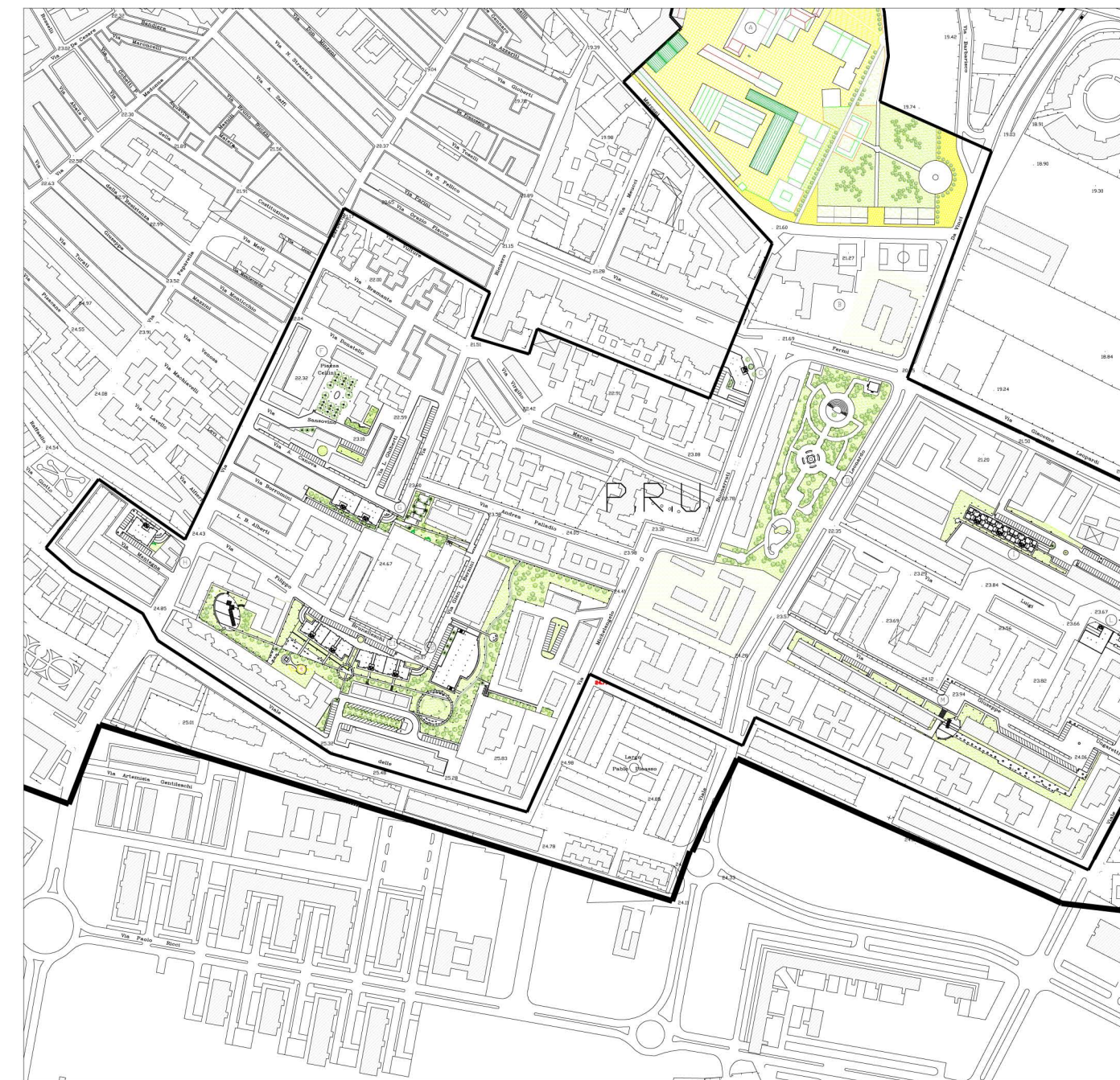
Stralcio P.R.U. - scala 1/2000