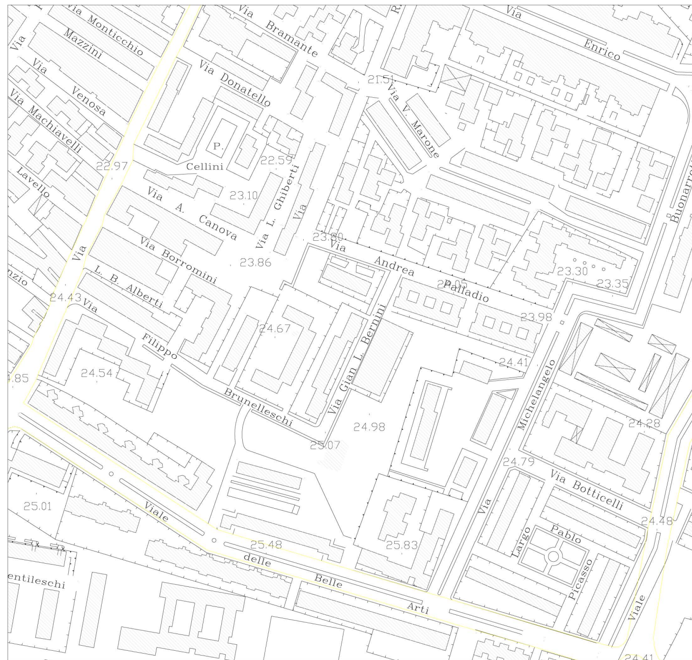
Stralcio Aerofotogrammetrico - scala 1/2000